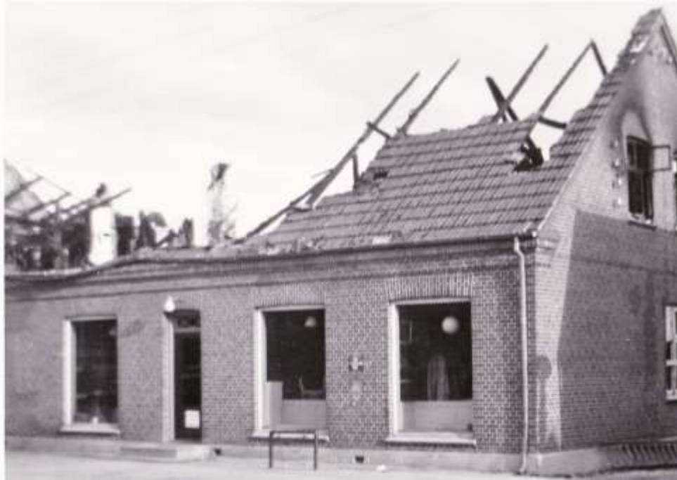
Efter branden i 1952 med den udbrændte loftetage.

Bestyrelsen løser foreløbig problemet og får opretholdt butikshandelen ved en aftale med Solrød Forsamlingshus, der udlejer sine lokaler til butik i et halvt år.