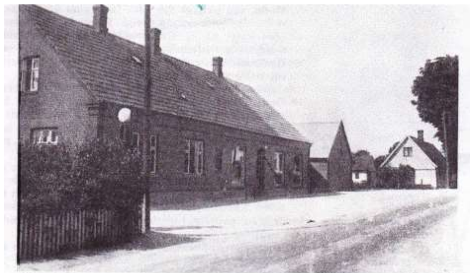
Brugsforeningen set fra vejen ved jubilæet i 1942.

Benzintanken anes ved bygningens østende og det nye udhus ses i vestenden.