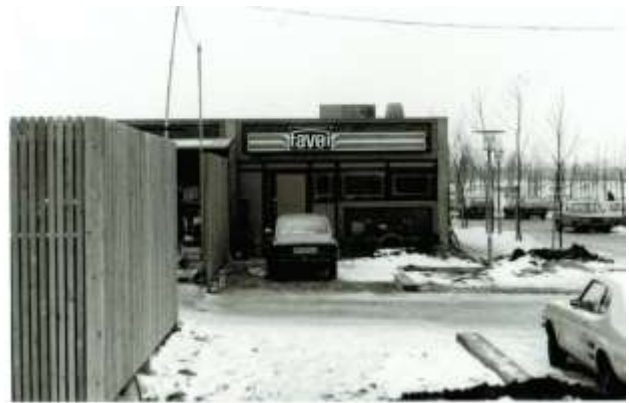
Et par af de første forretninger i Solrød Center