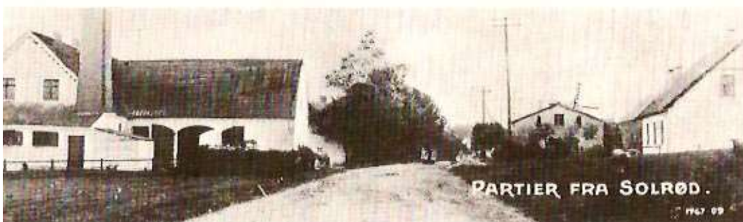
Partier fra Solrød landsby ca. 1905