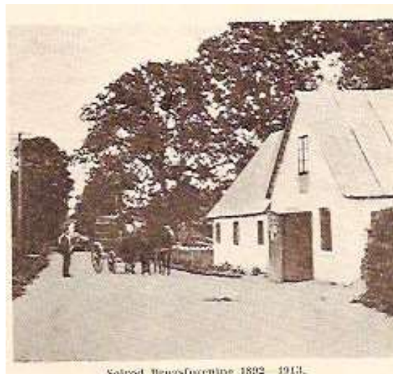
Den første brugsforening fra 1892