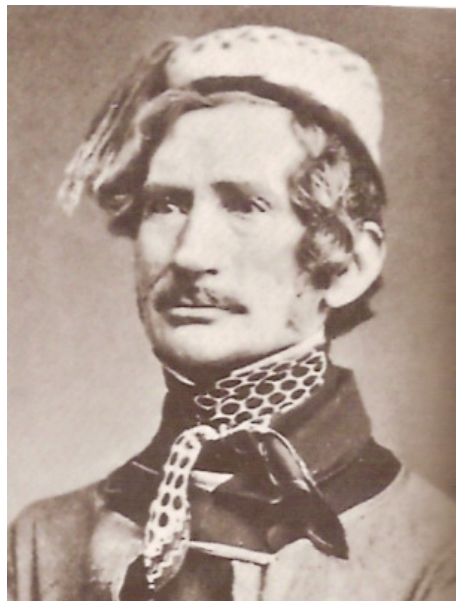
Overgeneral C.J. De Meza

Vi ved, at både den nye konge Christian IX og statsministeren D.G. Monrad i disse dage besøgte området, og det siges at De Meza gemte sig for at undgå politisk indblanding i krigsførelsen. Situationen var kritisk, idet det var hård vinter og såvel den lange fjord Slien i øst som moseområderne i vest var ved at fryse til, så fjenden kunne omgå stillingen. Dagen efter om aftenen afholdes det store krigsråd, hvor det på De Mezas anbefaling og ansvar besluttet at rømme stillingen. Kun en artillerigeneral protesterer og er bange for, at han ikke kan få sine kære kanoner med.